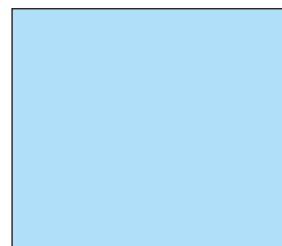
Campo 50 x 50 cm